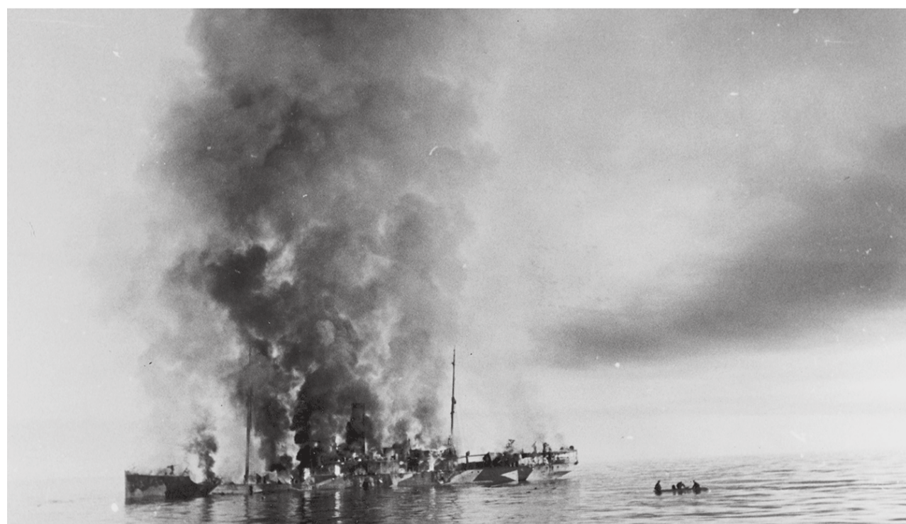
Гибель ледокола «Александр Сибиряков»

Позднее руководство кригсмарине пыталось представить поход «Адмирала Шеера» как победу, ссылаясь на потопление «большого русского ледокола» и «разгром Диксона». Но для себя его рейд рассматривали как эпический провал. Тысячи тонн потраченного дефицитного топлива, 20% расстрелянного боезапаса – и толком ничего. Потрепанный Диксон уже через двое суток вышел в эфир и сообщил, что работает в штатном режиме. Да и «Дежнев» и «Революционер» были отремонтированы менее, чем за неделю. А подвиг «Сибирякова» вошел в историю. Так что нацисты получили еще один урок: против советских людей у них шансов нет.