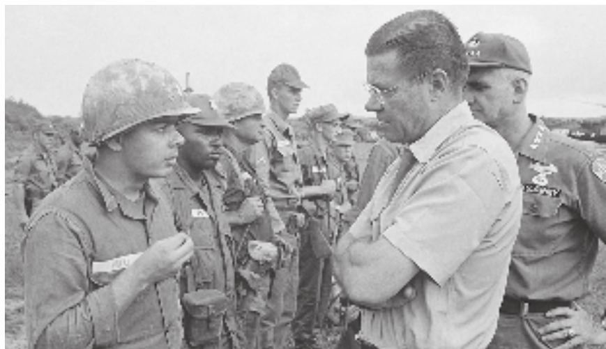
Роберт Макнамара с «людьми новых стандартов»

Французам пришлось уйти — но пришли США, которых совершенно не радовало появление нового социалистического государства. Поэтому они взяли на себя финансовую, политическую и военную поддержку сайгонского режима. Дела у последнего складывались не ахти: южновьетнамские партизаны (Вьетконг) вместе с северными товарищами вполне успешно воевали за создание единого социалистического Вьетнама.