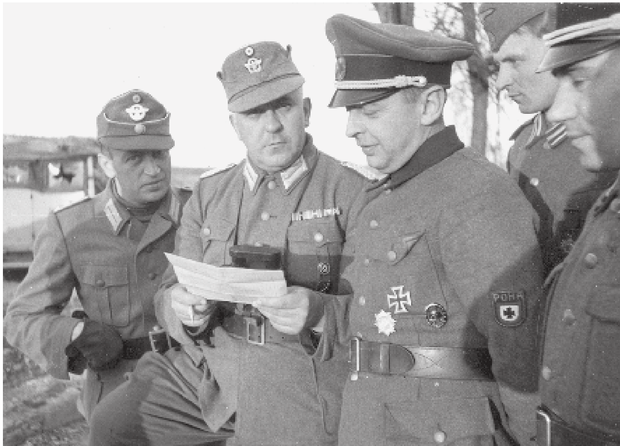
Бронислав Каминский с офицерами немецкой полиции

Странные и страшные убийства, потрясшие в 1973 году Брянскую область, нашли свое объяснение в далеком прошлом.