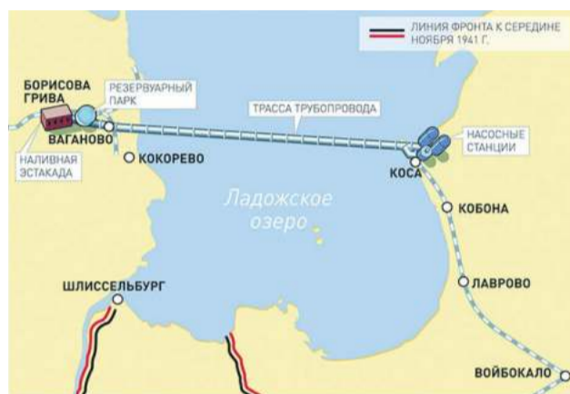
Схема трубопровода через Ладожское озеро. 1942 год

Проектные и строительные работы велись одновременно, так что то, что сегодня было в чертежах, завтра уже появлялось в металле. С короткими сухопутными участками трассы особых проблем не было: трубы