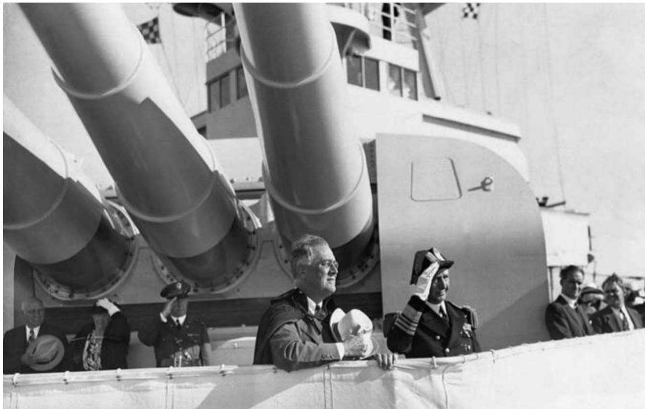
Президент Франклин Д. Рузвельт на борту линкора

Бывают невезучие корабли. Бывают неудачные стечения обстоятельств. Бывают оплошности команды. Но для того, чтобы все это сошлось вместе, это должен быть корабль военно-морского флота США. Именно таким и стал американский эсминец «Вилли Ди», заслуженно получивший прозвище «Тупой республиканец».