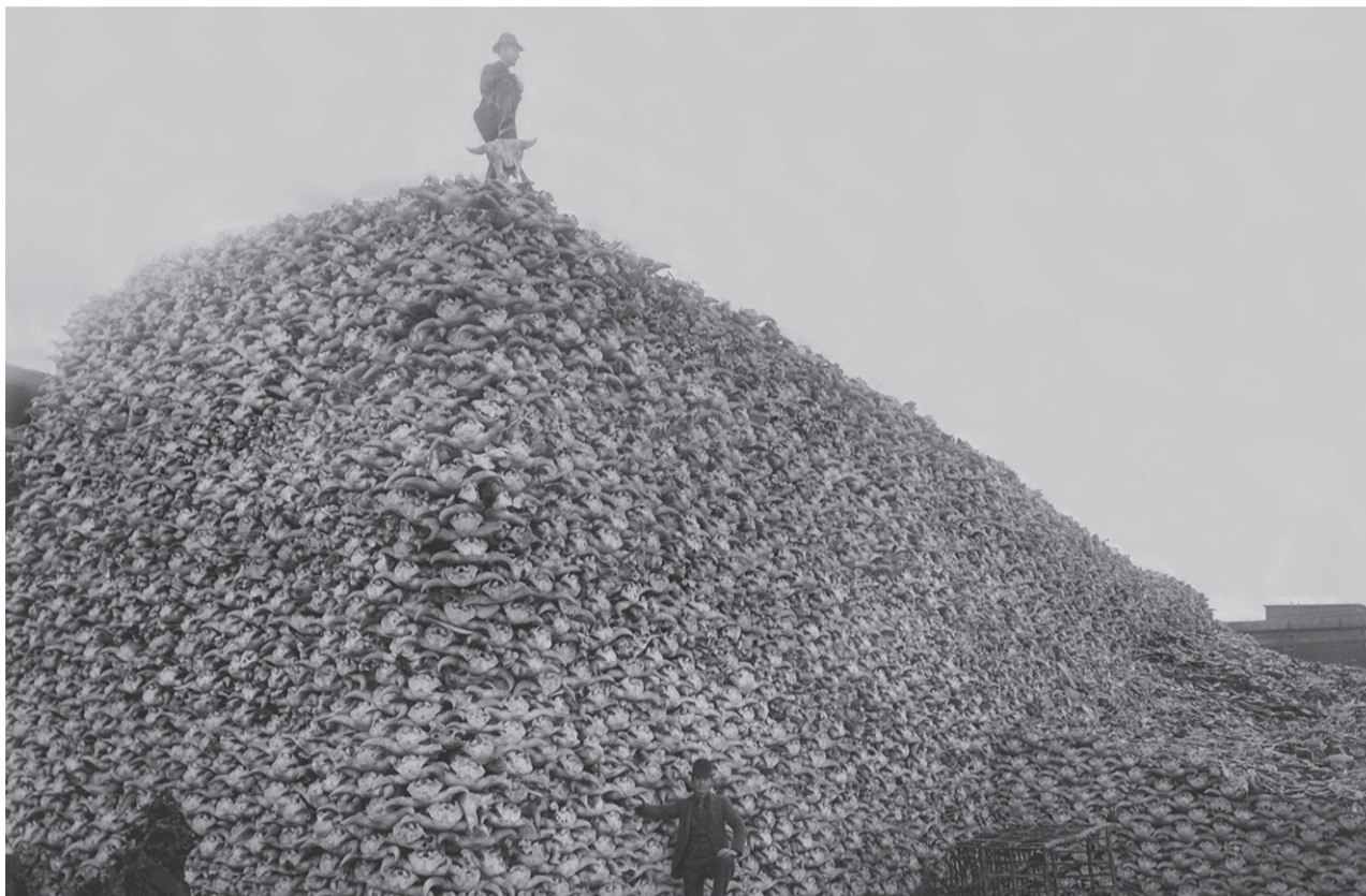
Пирамида из бизоньих черепов, 1870-е годы

В желании очистить территорию Северной Америки от коренного населения США не брезговали ничем – обманные договоры, «подарки» в виде одеял и одежды, зараженных оспой, к которой у индейцев не было иммунитета, бесконечные провокации – и это еще не все. «Окончательное решение» индейского вопроса по современным оценкам унесло не менее 100 миллионов индейских жизней. Не последним инструментом в этом стал геноцид бизонов.